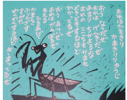
(版画のはらうたより)