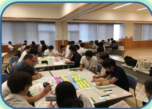
名中校区「小中一貫教育」小中合同研修会