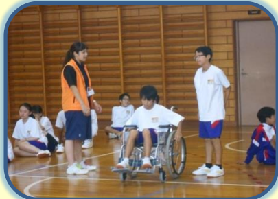
ゲストティーチャーをむかえて