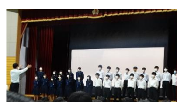
3年合唱コンクール