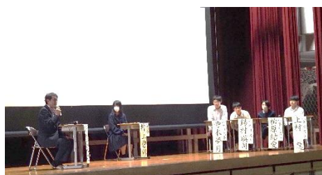
市長さんとパネルディスカッション