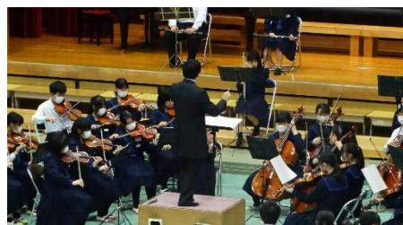
オーケストラ部の演奏