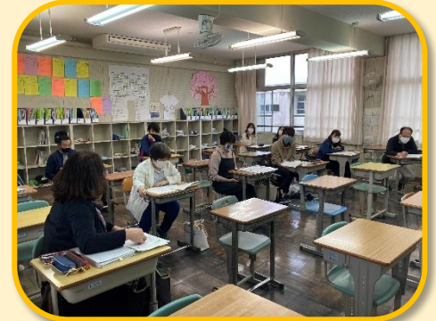
北中校区「小中一貫教育」 特別支援教育部会

特別支援学級の児童生徒の自立や社会性を養うことを目的に、交流を通して互いを理解する「もみじのつどい」を毎年実施しています。北中学校区では、小学校から中学校へのスムーズな接続をめざし、小中一貫教育の取組として中学校への入学前から中学校の校舎での交流をすすめています。