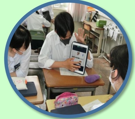
【北中校区 ふるさと学習「なばり学」カリキュラム】（一部抜粋）

北中校区の小中学校では、小中一貫教育の取組として、ふるさと名張を理解し、誇りや愛着を持ち、ふるさとを語ることができる子どもの育成を目指し、ふるさと学習「なばり学」をすすめています。この学習を通じて、将来の名張の担い手に育ててほしいと考えています。