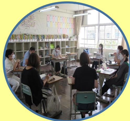
北中校区小中一貫教育 「道徳・キャリア教育部会」

北中校区の小中学校では、生き方についての考えを深め、自己実現を図ろうとする態度を育てることや自分のよさや成長に気づいたり、解決すべき自己の課題を見つけたいすることで、「なりたい自分」において、努力する態度を育てたいと考え、9年間を通した「キャリア教育」に取り組んでいます。今年度は9年間を通した「キャリアパスポート」の有効な活用について取組を進めています。