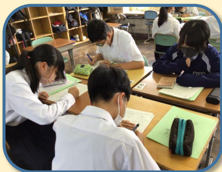
『職業調べ新聞』交流会