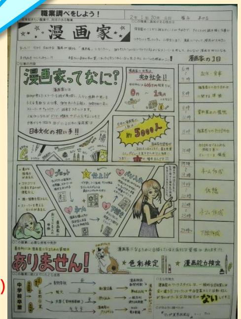
『職業調べ新聞』(生徒作品)