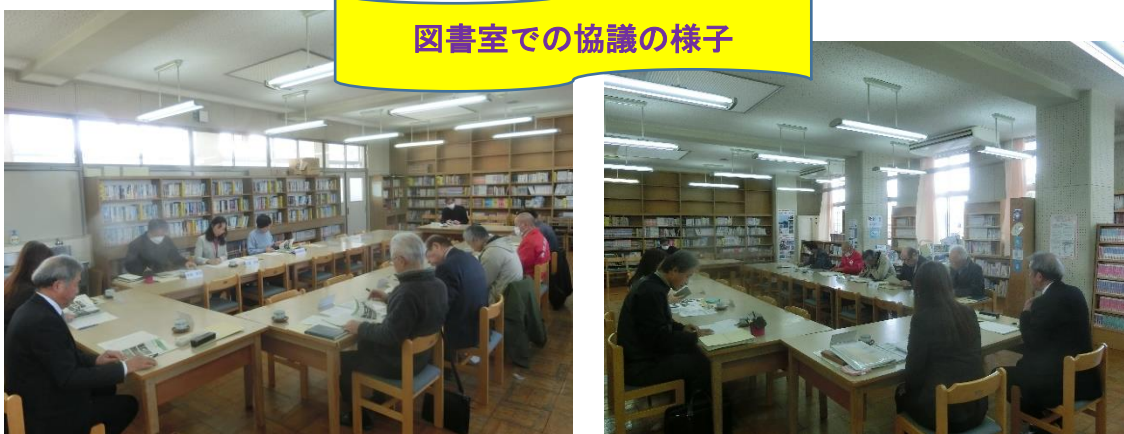
図書室での協議の様子

生徒・保護者・教職員による学校評価の分析を「HOKUTO 特別号」で示し、本年度の成果と次年度への課題を協議しました。