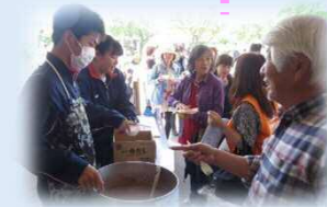
子どもフェスタへの参画