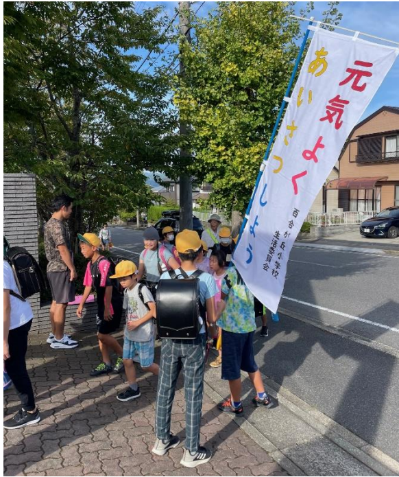
生活委員会「あいさつ運動」