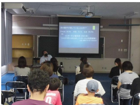
みんなで語ろう会

等の意見が出されました。またある本に書かれた記事に「PCやスマホ自体は悪いとは言えないし、むしろ現代においては必要かもしれません。しかし、いくつかの研究では、スマホを長時間使用する子どもは、読書量が少なく、学力が低い傾向にあるという結果が示されています。幼いころから。スマホ等に依存してしまい、抜け出せなくなり、ほかのことに支障をきたすようになってしまう危険性があります。自らの意志力やコントロール力が育っていれば、やるべきことがわかっていて、スマホも楽しみつつ、自らの意思で勉強も読書もできるようです。……」家庭でのスマホやゲームの使用について子どもと一度話し合ってみてはいかがでしょうか。