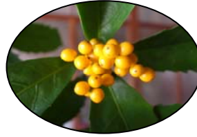
《きみのせんりょう》