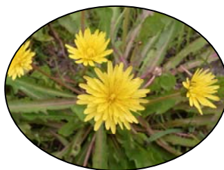
〈校舎前のたんぽぽ〉

企画、運営してくれた児童委員の皆さん、1年生をはじめ、みんなに楽しんでもらえてよかったですね。